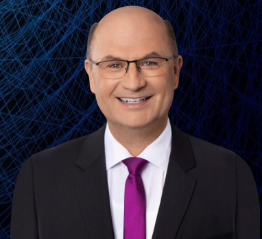
Schirmherr: Staatsminister Albert Füracker (MdB)

Bayerisches Staatsministerium der Finanzen und für Heimat